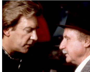
1983 EFFRACTION AVEC PRÉMÉDITATION (Crackers) de Louis Malle avec Donald Sutherland