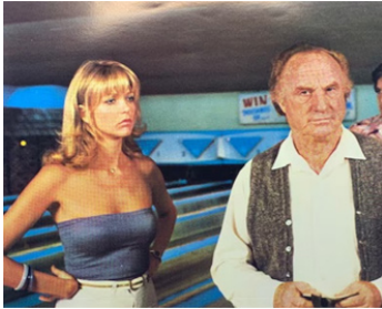
1978 DREAMER (Dreamer) de Noel Nosseck avec Susan Blakely