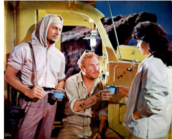
1960 LES FUYARDS DE ZAHRAIN (Escape from Zahrain) de Ronald Neame avec Yul Brynner