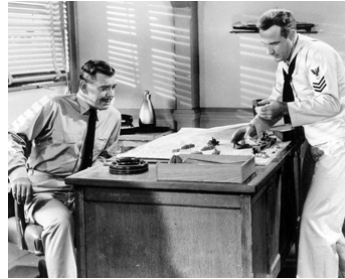
1958 L'ODYSSÉE DU SOUS-MARIN NERKA (Run silent run deep) de Robert Wise avec Clark Gable