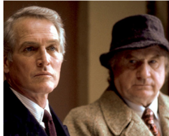
1982 LE VERDICT (The Verdict) de Sidney Lumet avec Paul Newman