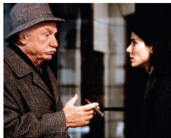
1994 L'AMOUR À TOUT PRIX (While you were sleeping) de Jon Turteltaub avec Sandra Bullock