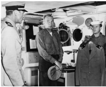
1950 LES DÉGOURDIS DE LA MARINE (You're in the Navy now) d'H. Hathaway avec Gary Cooper