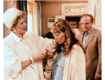
1987 SEPTEMBER (September) de Woody Allen avec Elaine Stritch, Mia Farrow