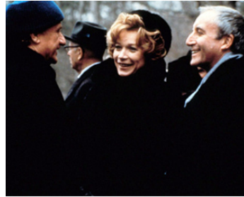
1979 BIENVENUE MISTER CHANCE (Being there) d'Hal Ashby avec Sh. MacLaine, Peter Sellers