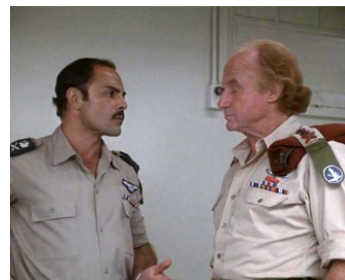
1976 RAID SUR ENTEBBE (Raid on Entebbe) d'Irvin Kershner avec John Saxon