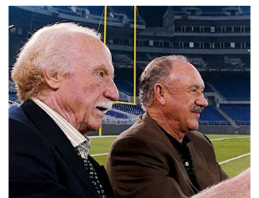
2000 LES REMPLAÇANTS (The Replacements) d'Howard Deutch avec Gene Hackman