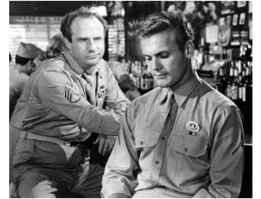
1959 UNE ESPÈCE DE GARCE (That Kind of Woman) de Sidney Lumet avec Tab Hunter