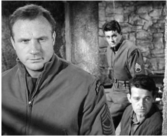
1957 LES COMMANDOS PASSENT À L'ATTAQUE (Darby's Rangers) de W. Wellman avec S. Whitman