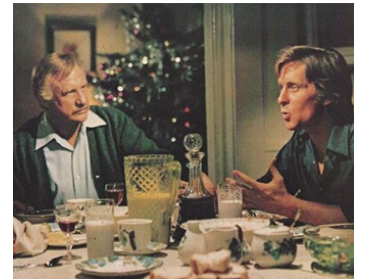
1971 SUMMERTREE (Summertime) d'Anthony Newley avec Michael Douglas