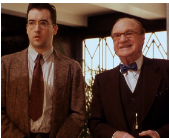
1994 COUPS DE FEU SUR BROADWAY (Bullets over Broadway) de W. Allen avec John Cusack