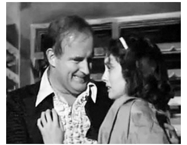
1978 LE DERNIER SECRET DE POSEÏDON (Beyond the Poseidon) d'I. Allen avec Angela Cartwright