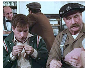
1974 L'APPRENTISSAGE DE DUDDY KRAVITZ (Duddy Kravitz) de T. Kotcheff avec R. Dreyfuss