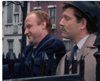
1968 BYE BYE BRAVERMAN de Sidney Lumet avec George Segal