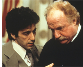
1979 JUSTICE POUR TOUS (... and Justice for all) de Norman Jewison avec Al Pacino