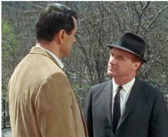
1964 LES YEUX BANDÉS (Blindfold) de Philip Dunne avec Rock Hudson