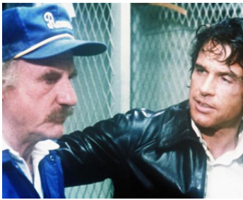
1977 LE CIEL PEUT ATTENDRE (Heaven can wait) de et avec Warren Beatty