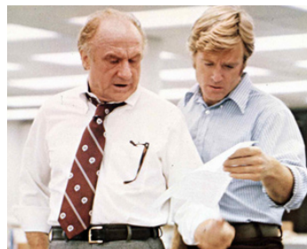
1975 LES HOMMES DU PRÉSIDENT (All the President's Men) d'A. Pakula avec R. Redford