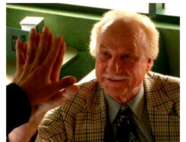
1995 DERNIÈRES HEURES À DENVER (Things to do in Denver...) de Gary Flerder