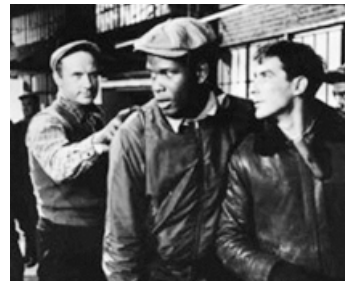
1957 L'HOMME QUI TUA LA PEUR (Edge of the City) de M. Ritt avec S. Poitier, J. Cassavetes