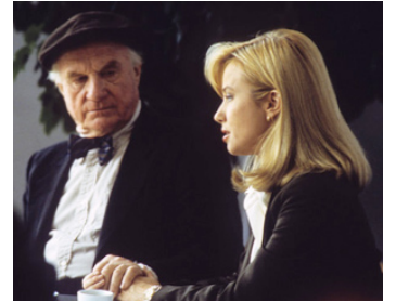
1993 L'AVOCAT DU DIABLE (Guilty as Sin) de Sidney Lumet avec Rebecca De Mornay