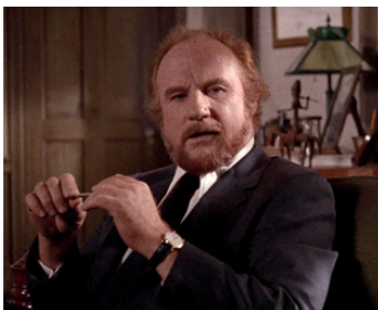
1971 QUI EST HARRY KELLERMAN ? (Who is Harry Kellerman) d'Ulu Grosbard