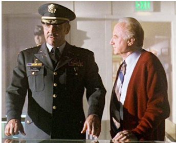
1988 PRÉSIDIO (The Presidio) de Peter Hyams avec Sean Connery