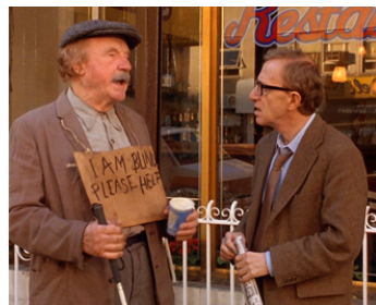
1995 MAUDITE APHRODITE (Mighty Aphrodite) de et avec Woody Allen