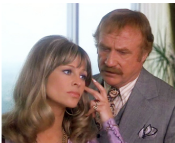
1974 SHAMPOO (Shampoo) d'Hal Ashby avec Julie Christie