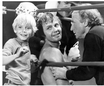
1978 LE CHAMPION (The Champ) de Franco Zeffirelli avec Ricky Schroeder, Jon Voight