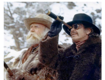
1977 LE BISON BLANC (The White Buffalo) de Jack Lee-Thompson avec Charles Bronson