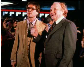
1980 LES FESSES À L'AIR (So Fine) d'Andrew Bergman avec Ryan O'Neal