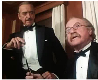
1977 MORT SUR LE NIL (Death on the Nile) de John Guillermin avec David Niven