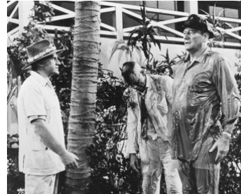
1962 LA TAVERNE DE L'IRLANDAIS (Donovan's Reef) de John Ford avec John Wayne