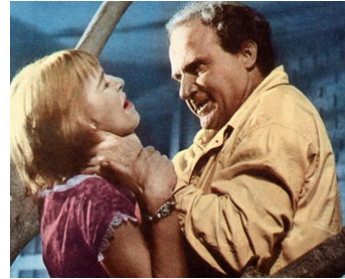
1959 LE BRUIT ET LA FUREUR (The Sound and the Fury) de Martin Ritt avec Joanne Woodward