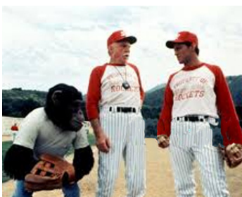
1996 ED (Ed) de Bill Couturié avec Matt Le Blanc