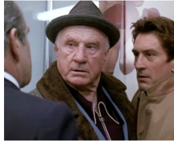
1992 LA LOI DE LA NUIT (Night and the City) d'Irwin Winkler avec Robert De Niro