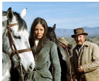
1973 LE FANTÔME DE CAT DANCING (Cat Dancing) de R. Sarafian avec Sarah Miles