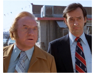
1979 LA GROSSE MAGOUILLE (Used Cars) de Robert Zemeckis avec Joe Flaherty