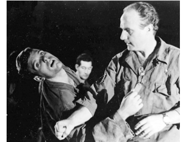
1963 L'ATTAQUE DURA 7 JOURS (The Thin Red Line) d'Andrew Marton avec Keir Dullea