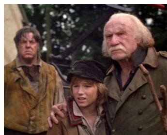
1999 NELLO LE CHIEN DES FLANDRES (A Dog of Flanders) de Kevin Brodie avec J. J. Kisner