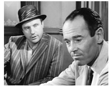
1957 DOUZE HOMMES EN COLÈRE (Twelve angry Men) de Sidney Lumet avec Henry Fonda