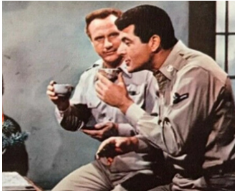
1960 L'ÎLE DES SANS-SOUÇIS (Wake me when it's over) de Mervyn LeRoy avec Dick Shawn